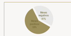
Gráficos após mudanças comentadas em *